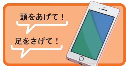
音声認識によるスイッチ

頸髄損傷や神経難病、関節リウマチなど、通常のベッドスイッチが使えない方を対象に、障害に合わせた物理的スイッチや、音声認識によるスイッチを提供いたします。