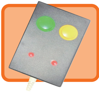
各種物理的スイッチ