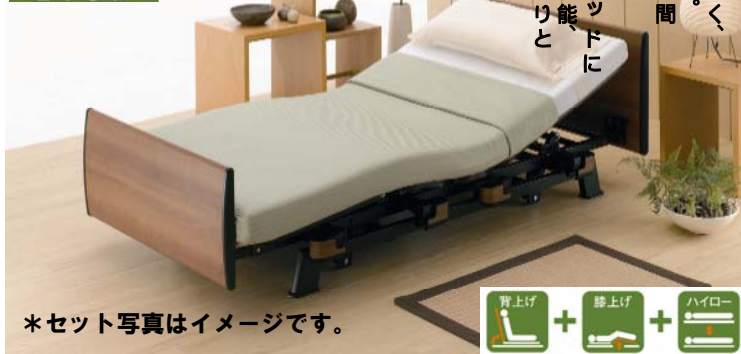
*セット写真はイメージです。

日本の伝統・感性を深く、どこまでも静かに継承。それでも「洋」の空間にもフィットする。モダンな感覚。もちろん生活支援用ベッドに求められる卓越した機能と搭載した先進のシリーズです。