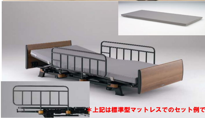
*上記は標準型マットレスでのセット例です。

日本の伝統・感性を深く、どこまでも静かに継承。それだけで「洋」の空間にもフィットする。モダンな感覚。もちろん生活支援用ベッド求められる卓越した機能、確かな操作性をしつかりと搭載した先進のベッドシリーズです。