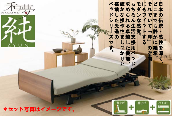
*セット写真はイメージです。

日本の伝統・感性を深く、どこまでも静かに継承。それだけで「洋」の空間にもフィットする。モダンな感覚。もちろん生活支援用ベッド求められる卓越した機能、確かな操作性をしつかりと搭載した先進のベッドシリーズです。